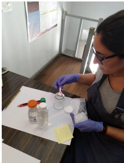
Figura 3: Tareas de limpieza y saneamiento.

El equipo interdisciplinario del grupo ReTrOH ha consensuado en respetar el orden en que el material fue hallado, conservar la nomenclatura y la secuencia en que se encuentran en dichas cajas. Por lo tanto, esta es la forma en que se organizará el archivo, respetando su origen.