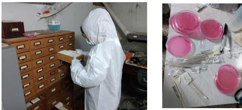
Figura 2: Estudios ambientales del recinto Grant y de la muestra.

Se prevé un plan de saneamiento del recinto del sótano, actividad que fue pospuesta por la situación de pandemia durante los años 2020 y 2021.